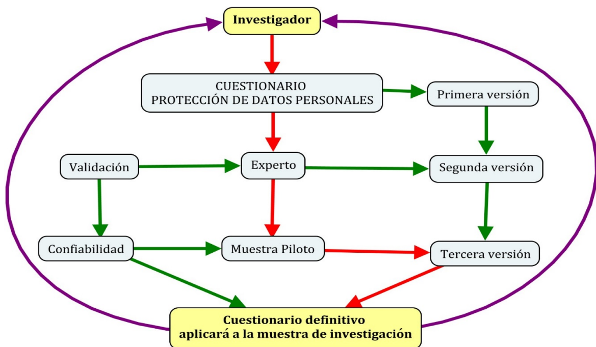
Figura 1. Metodología de construcción del cuestionario protección de datos personales

También se realiza la validez factorial confirmatoria, porque se tiene en cuenta las dimensiones (Figuroa, 2013), para determinar “qué factores están relacionados entre sí, y qué ítems están relacionados con cada factor” (Lloret, Ferreres, Hernández y Tomás, 2014, p. 1154).